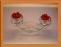
Formano/Bollweg 2er Teelichtleucher

Mitten im Herzen von Köln -Ehrenfeld liegt unsere Bäckerei. Kommen Sie vorbei lassen Sie sich inspirieren ,von einer großen Auswahl an köstlichem Gebäck sowie vielen schönen Geschenkideen aus dem Hause Formano/Bollweg .